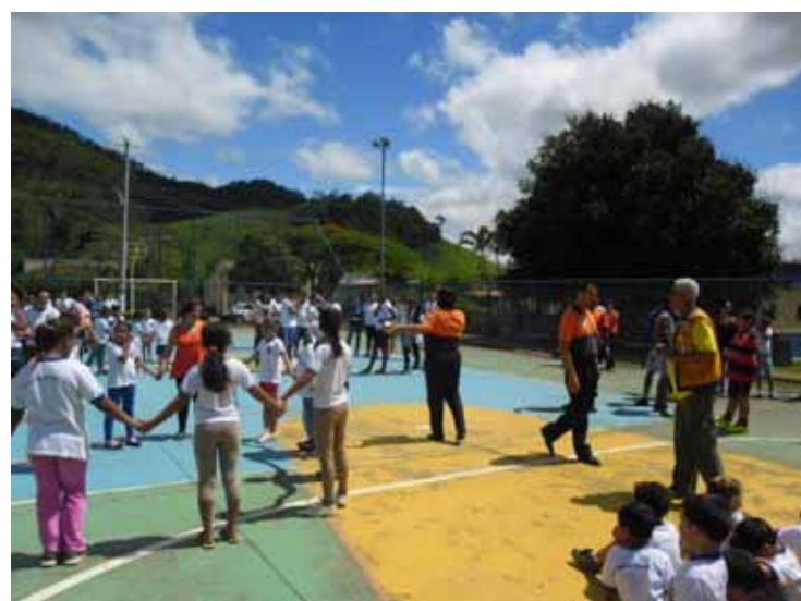
Objetivo é prevenir acidente em casos de emergência