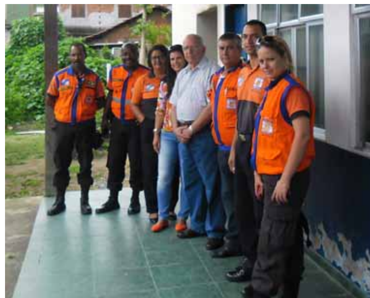
Equipe da Defesa Civil e do município