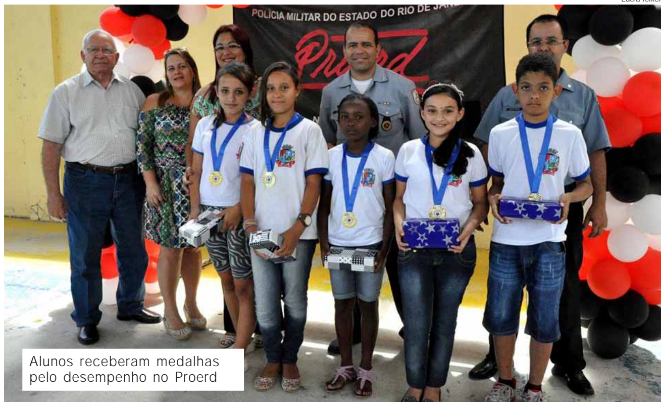
Alunos receberam medalhas pelo desempenho no Proerd

O Proerd trabalhou neste ano temas como autoestima, amizade, bullying de forma interativa e, através de músicas e outras atividades, conseguiu inserir a ideia de prevenção às drogas. O policial afirmou que deseja que os alunos sejam multiplicadores dessas informações e que os pais continuem orientando seus filhos na questão das drogas e da violência.