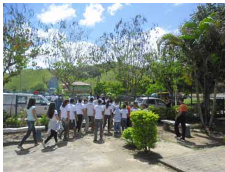
Alunos se dirigem à quadra na simulação