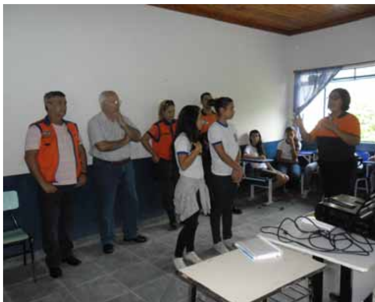
Palestra orienta alunos sobre a simulação