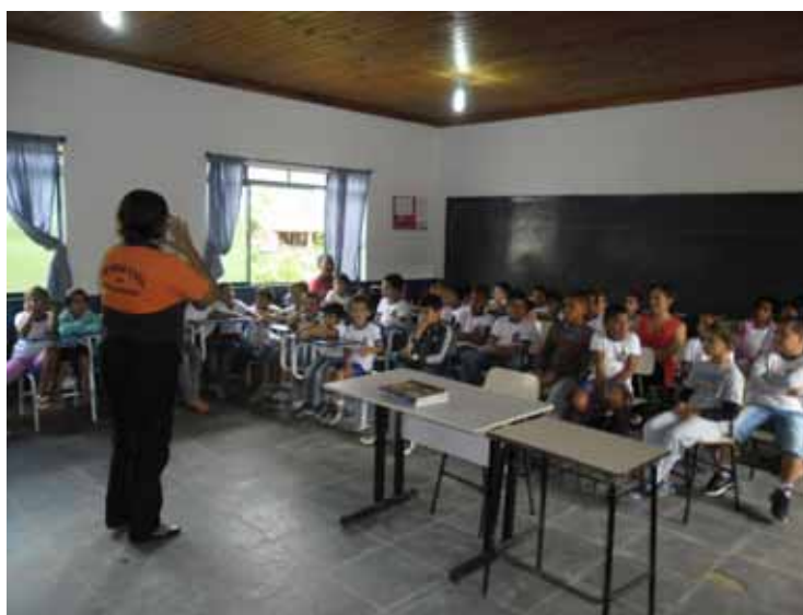
Estudantes se preparam para a evacuação