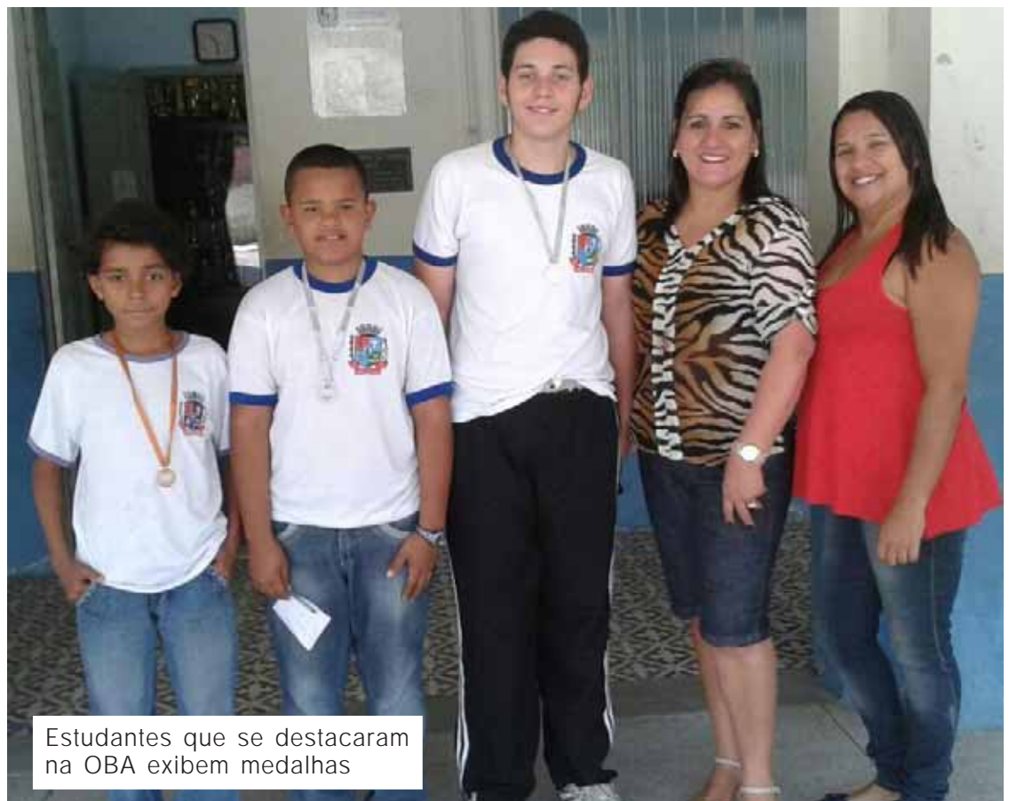
Estudantes que se destacaram na OBA exibem medalhas

A OBA é direcionada a estudantes do Ensino Fundamental ou Médio matriculados em escolas públicas ou particulares. Os alunos com melhores classificações poderão participar de eventos até internacionais. O objetivo da olimpíada é levar a maior quantidade de informações sobre ciências espaciais para a sala de aula, além de despertar o interesse dos jovens por essas disciplinas.