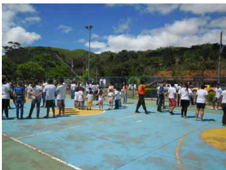
Todo o procedimento foi orientado pela Defesa Civil