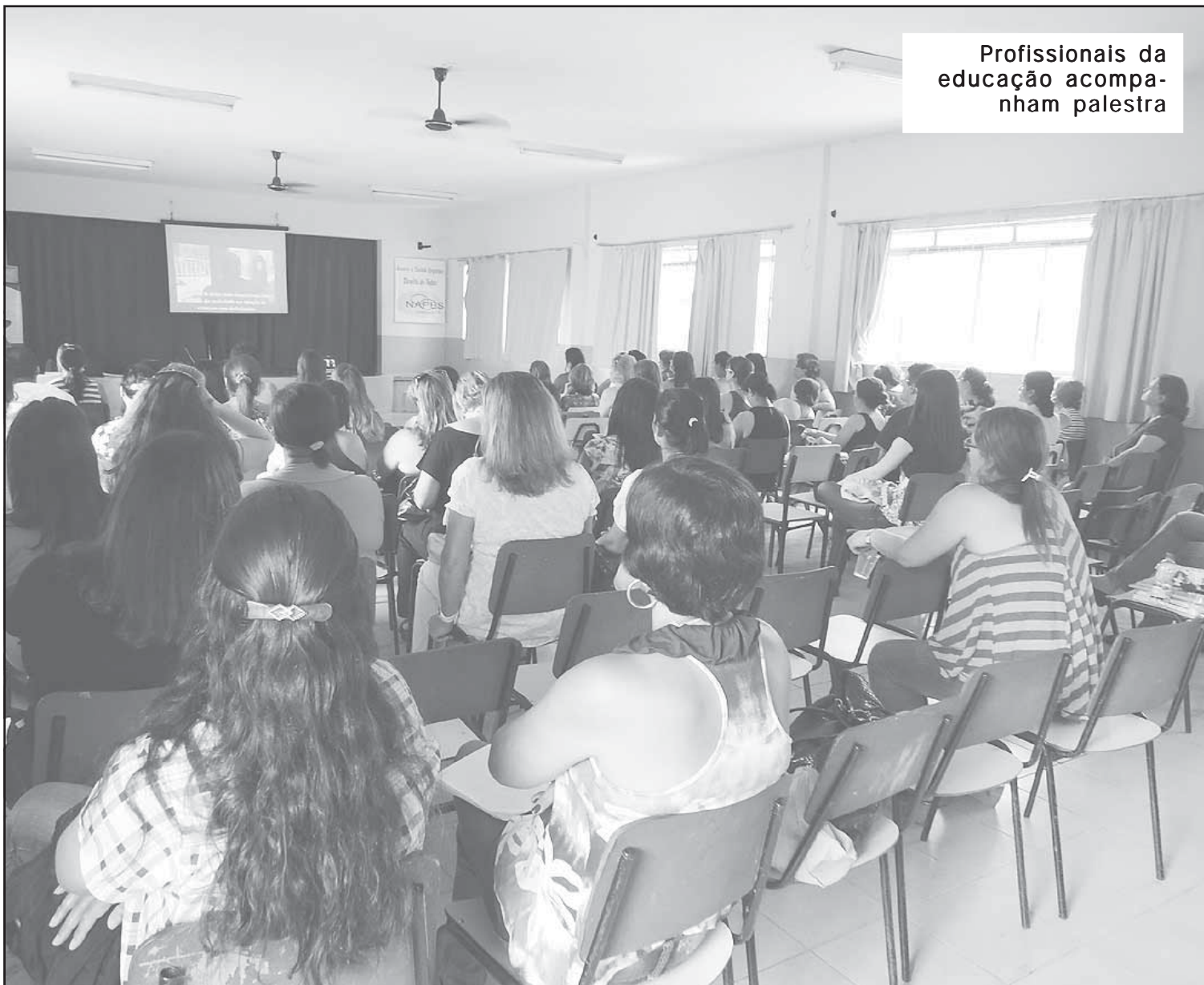
Profissionais da educação acompanham palestra