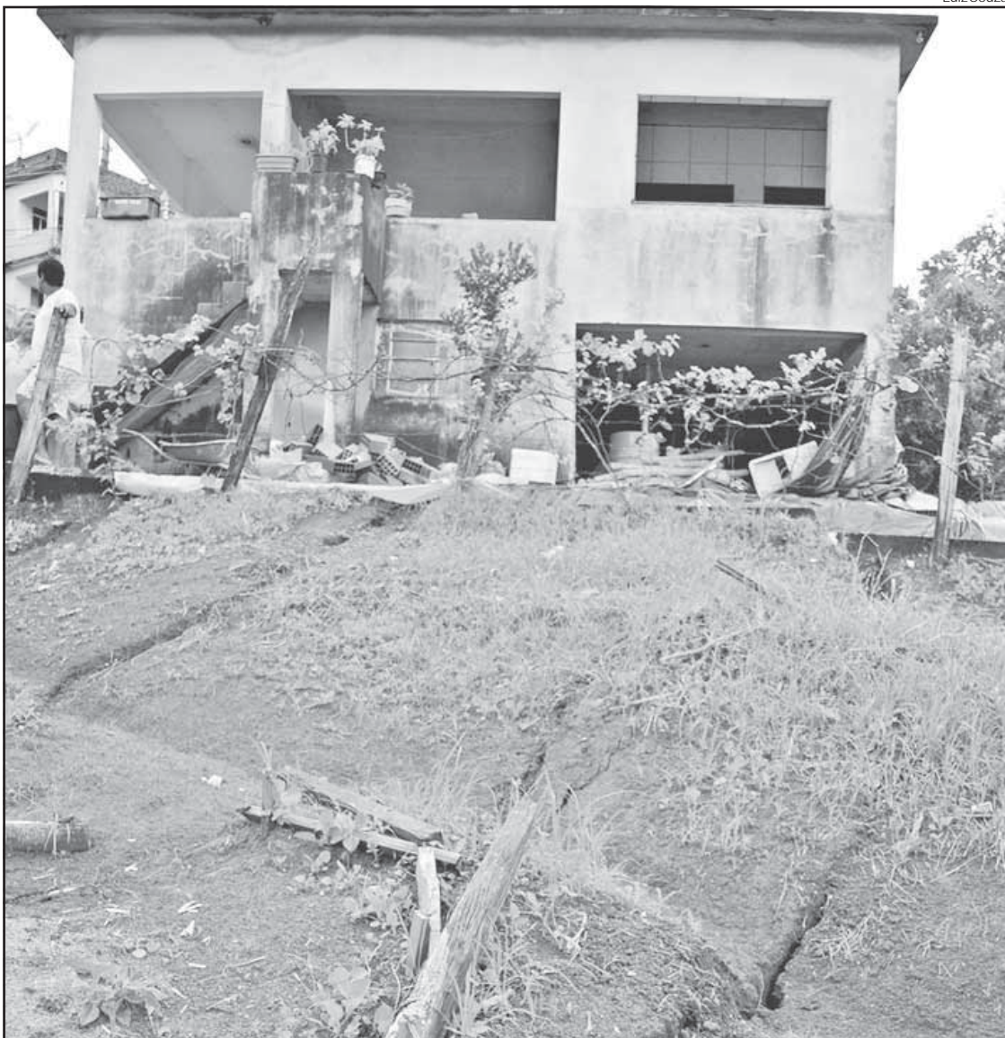
Rachaduras no solo comprometem situação das casas