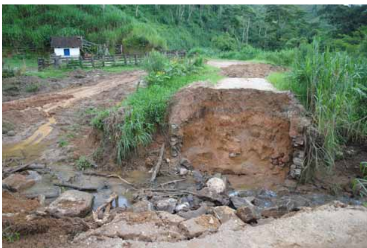
Trecho de estrada no São Roque destruído com a chuva