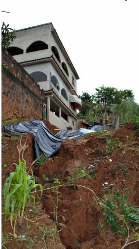
Enxurrada destrói ponte na Água Fria