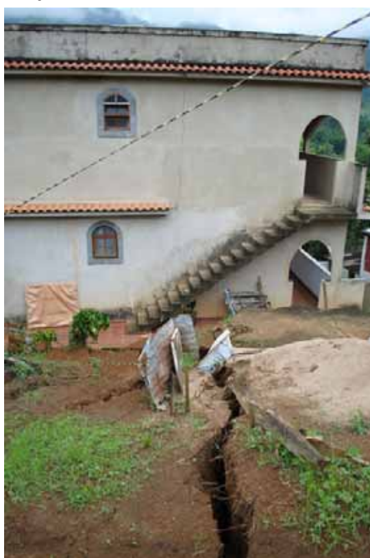
Rachaduras no solo e nas casas agravam situação