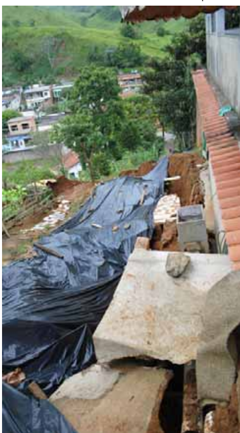
Casas correm risco de cair