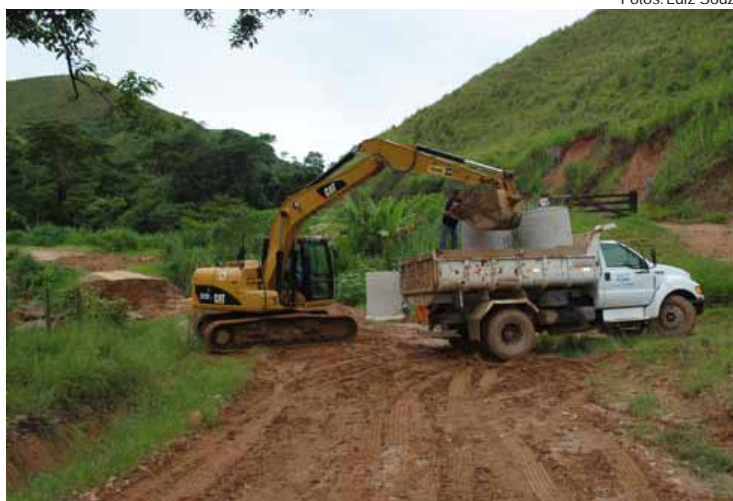
Prefeitura já começou obras nas estradas