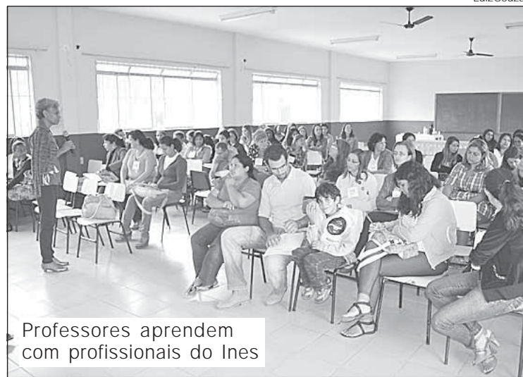
Professores aprendem com profissionais do Ines

Em parceria com a Universidade Federal Fluminense (UFF) de Angra dos Reis, a Prefeitura vai oferecer a diretores das escolas