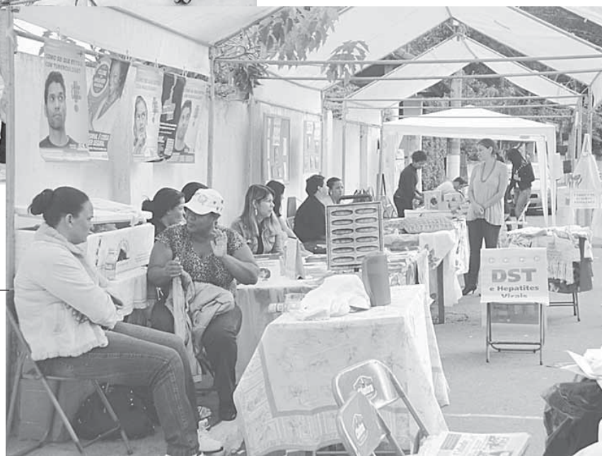
Feira da Cidadania e seus estandes em Passa Três