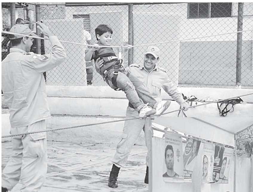
Crianças brincaram com o auxílio dos bombeiros