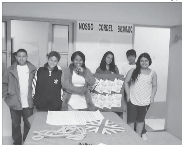
Alunos expõem trabalhos sobre a literatura de Cordel

Em frente ao Rio Ipiranga, A Independência proclamou. Antes passou aqui na Gramma, Deixando marcas que o tempo guardou. Naquele tempo de Inconfidência Dom Pedro proclamou independência.