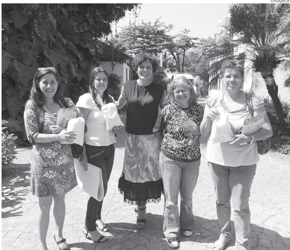
Secretária de Educação recebe kit para analisar a água

O projeto pH do Planeta é uma atividade realizada no Brasil e em todo o mundo, visando integrar uma série de eventos propostos pela Organização das Nações Unidas para a Educação, Ciência e Cultura (UNESCO), pela União de Química Pura e Aplicada (IUPAC) e pelo Ministério da Ciência e Tecnologia, para melhorar a educação e a pesquisa em química no país.