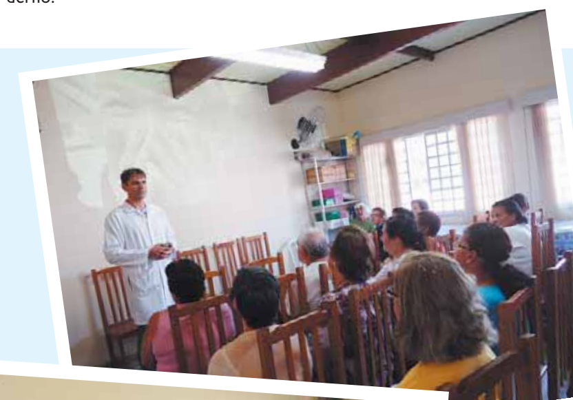
Dia 29 de setembro Lídice

Os idosos viajaram para Lídice e passaram o dia no distrito, onde se reuniram para debater assuntos em comum e tomaram um café-da-manhã caprichado, oferecido pelo Centro de Convivência do Idoso.