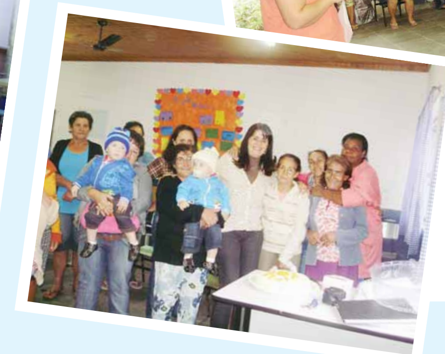
Dia 28 de setembro Passa Três e Macundu

Durante a manhã, o grupo participou de um coffee break em Passa Três e durante a tarde, a terceira idade se reuniu em Macundu para conversar e participar de um brunch.