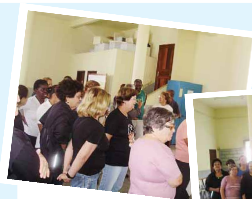
Dia 30 de setembro Rio Claro

Durante a manhã, o grupo participou de um coffee break em Passa Três e durante a tarde, a terceira idade se reuniu em Macundu para conversar e participar de um brunch.