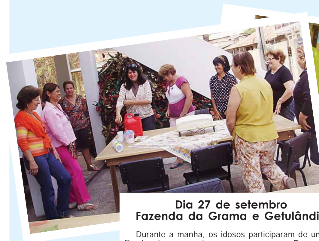
Dia 27 de setembro Fazenda da Grama e Getulândia

frutaram de palestras, reuniões e coffee break para se entreter e se informar sobre diversos assuntos importantes do cotidiano.