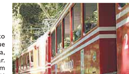
Trem cruza a Floresta da Tijuca para chegar ao Cristo